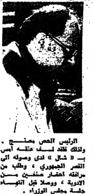
الرئيس الحص - صنعج

الانفجاران في واشنطنن أحدهما قرب البيت الأبيض في انفجاران وسط واشنطن فجر امس، وقد وقع احدهما خارج مكتب الخطوط الجوية السويديتية «ايروفلوت» في الحي الذي يقع بين انقارون وشاشل الصيقة خارج مكتاب «ايروفلوت» ابلاغ شخص قال انه عضو في مجموعة من الكويين الثقلين اطلقوا النار بواسطة الهاتف ان نقلته مسؤولة عن الانفجار. واضاف يقول ان قاسبل اخرى جاهزة للانفجار بالقرب من البيت الابيض. وبعد لحظات انفجرت القنبلات الثلاثة في محل يبيع ملابس في الشارع على قبل القيام بجولات في البيت الابيض. وتترك هذا الانفجار حفرة يبلغ اتساعها عشرة انبار. وقال الرجل الذي تكلم بالهاتف في ان مقلته تتجح على الدمع السويديتية تكوبا وعلى خرق حقوق الانسان، - البقية على الصفحة ١٠.